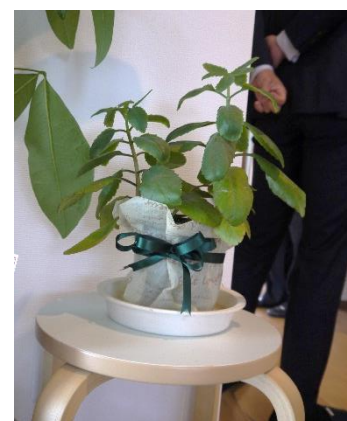
マザーリーフ（観葉植物）